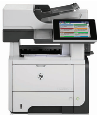
HP LaserJet Enterprise flow M525c MFP