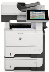
HP LaserJet Enterprise 500 M525f MFP